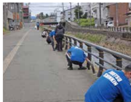
信金の日(6月15日)の環境美化運動