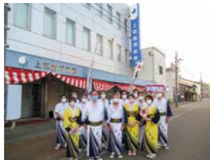
上越まつり祇園祭参加