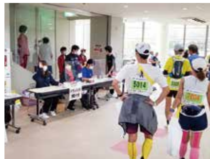
100kmマラソンボランティア