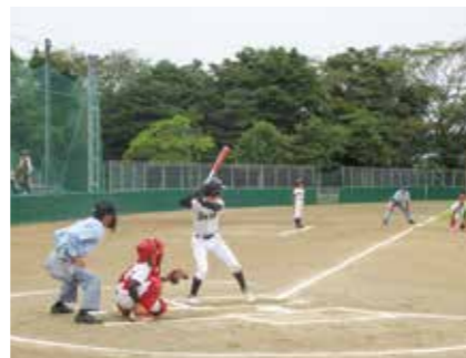
学童野球大会協賛