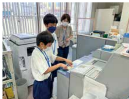
金融リテラシー活動②