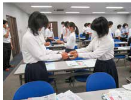
金融リテラシー活動①