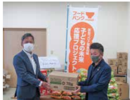
SDGs私募債による寄付