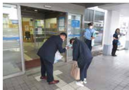
【特殊詐欺被害防止活動】