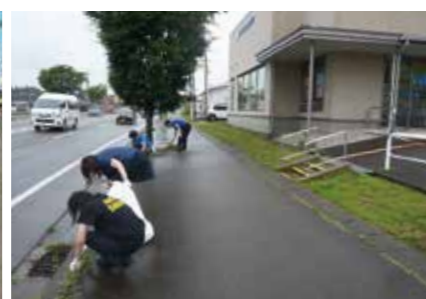
【信金の日(6月15日)環境美化活動】