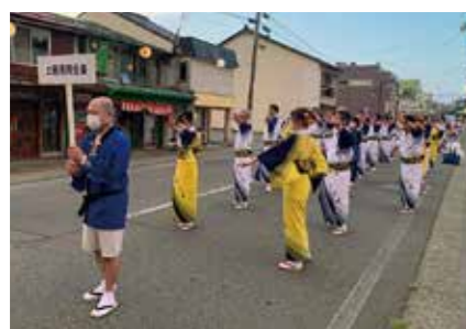
【上越まつり祇園祭参加】