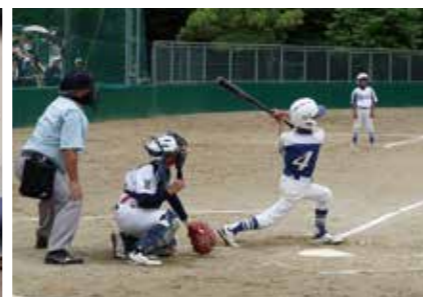
【学童野球大会協賛】