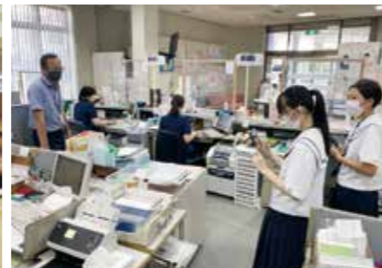
【金融リテラシー活動】