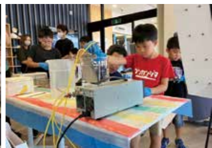
【お子様向けワークショップ】