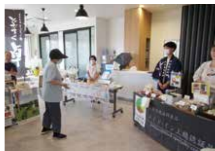
【地元業者様の販売会】